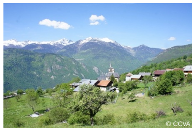
SCHÉMA DE DÉVELOPPEMENT TOURISTIQUE DES COTEAUX D'AIGUEBLANCHE 2014 & 2015 | CCVA | Aigueblanche (73)

Diagnostic, proposition et conception d'un projet de valorisation du coteau d'Aigueblanche : sentier d'interprétation, promenade sonore, haltes et espaces de détente, circuits VTT familiaux et mini bike-park.