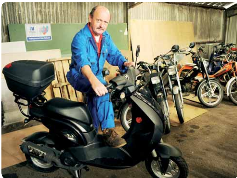
> L'association Mobil'Emploi propose un moyen de transport aux personnes en insertion professionnelle, par exemple la location de véhicules deux-roues.

N avette, location de cyclomoteur ou de voiture : l'association Mobil'Emploi propose aux personnes en insertion professionnelle un moyen de transport. Parce que pour se rendre à un entretien d'embauche dans certains secteurs géographiques ou remplir une mission d'intérim à horaires atypiques, on n'a pas toujours la possibilité de se déplacer en transport collectif.