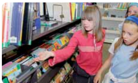
> Au 2 e étage, la "Fabrique" propose des milliers de CD et DVD à l'emprunt.