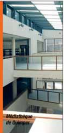
Médiathèque de Quimper

Contactez-nous : GTB CONSTRUCTION 5, rue de Cronstadt – BP 72311 29223 BREST Cedex 2 Tél. 02 98 44 64 64 www.gtb-construction.fr