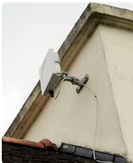
> Pour les sites éloignés des centraux téléphoniques, le Wimax est en phase de déploiement

Le réseau haut débit Hermineo continue d'être amélioré pour permettre à tous, particuliers comme entreprises de Quimper Communauté, d'avoir accès aux meilleures connexions Internet et de bénéficier de services innovants.