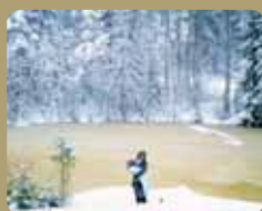
> Ville Lenkkeri Lisa... de la série Civil Courage , 2008 Photographie (130x154 cm)