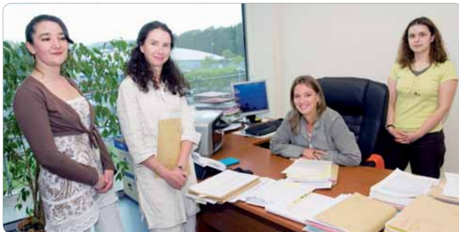
> Implanté à l'hôtel d'entreprises de Quimper Communauté à Creach Gwen, le cabinet Poupon apporte son expertise en matière de propriété intellectuelle et industrielle.

Cabinet Poupon, Hôtel d'entreprises de Quimper Communauté, 4 rue de Kerogan à Creach Gwen, Quimper. Tél. : 02 98 10 24 00 / E-mail : cabinet@poupon.net