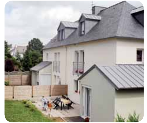
> Le bourg de Pluguffan s'urbanise avec de nombreuses constructions et notamment, une offre en locatif qui s'élargit.

Comment marier harmonieusement développement de l'habitat et agriculture ? Pluguffan a choisi de privilégier une urbanisation raisonnée et centrée sur le bourg, avec une offre en locatif qui s'élargit. Nombreuses sont les constructions qui sortent de terre cette année. Les structures communales sont en mesure de répondre aux attentes de la population.