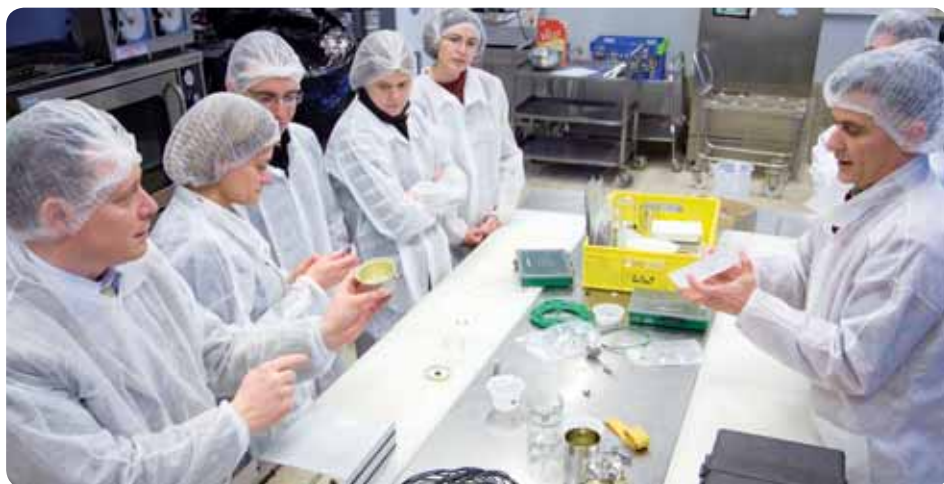
> L'ADRIA est l'un des centres d'innovation technologique (CIT) bénéficiant du soutien financier de Quimper Communauté.

Quimper Communauté renforce son soutien à l'innovation, notamment dans les domaines de l'agroalimentaire, de l'emballage et des nouvelles technologies. Son investissement annuel de 152 500 €, dans le cadre du Contrat de projets État-Région, appuie les Centres d'innovation technologique (CIT) pour du conseil, de la mise en relation et de l'accompagnement de projets.