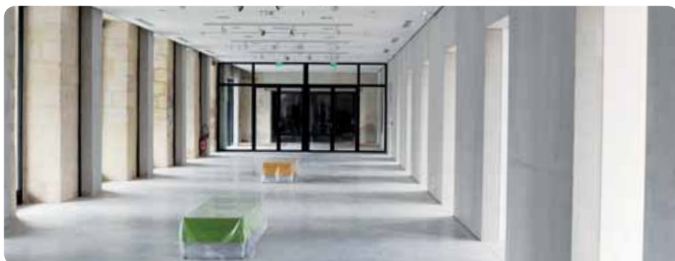
> Au rez-de-chaussée, la galerie Max Jacob accueillera des expositions.

Le deuxième étage permet des perspectives inédites sur les gargouilles de l'église Saint-Mathieu et le théâtre de Cornouaille. Côté "Boîte aux savoirs", on est dans les documents. Côté "Fabrique", c'est au bonheur des amateurs d'art, de BD, CD, DVD : un fonds considérablement enrichi, auquel s'ajoute la bibliothèque bretonne. La salle François-Marie Luzel (folkloriste breton du 19 e siècle) peut aussi accueillir, comme celle de l'étage inférieur, des groupes d'adultes constitués en atelier.