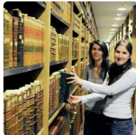
> Le fonds patrimonial regroupe 75 000 ouvrages anciens.