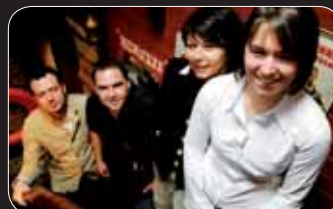
> Le chant des sardinières

Organisé par l'association César Franck. Tél. : 02 98 95 44 26.