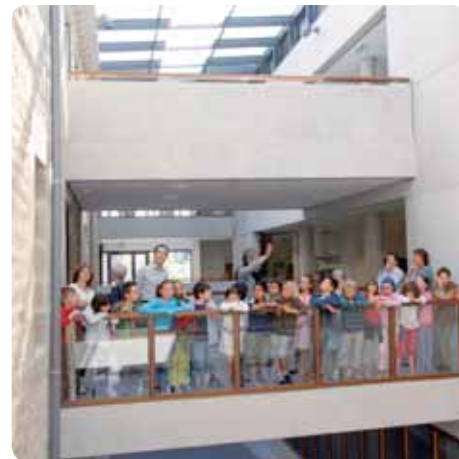
> Tête du réseau de lecture publique de Quimper Communauté, la médiathèque des Ursulines joue la carte de la convivialité pour son ouverture.

Cette rentrée 2008 est placée sous le signe de l'ouverture de la médiathèque des Ursulines. Équipement phare de l'agglomération, elle incarne son ambition culturelle. Inscrite au cœur de la ville de Quimper, elle entend être un lieu de vie, de rencontres, de découvertes. Elle joue la carte de la convivialité pour son inauguration : à partir du 6 septembre, des compagnies théâtrales et musicales invitent un public très large à entrer, parler, rire, et ainsi s'approprier le bâtiment.